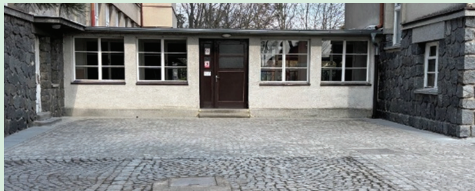
Oprava příchodu ke vchodu do Masarykovy základní školy v Dolní Rovni – výměna poškozeného asfaltového povrchu za původní dlažební kostky.

Tento rozlehlý komplex budov by si jistě zasloužil celkovou rekonstrukci, neboť se jedná o funkční dominantu obce a zároveň památku na našeho nejznámějšího rodáka Františka Udržala. Postupnými kroky se budeme snažit tuto budovu vylepšovat. Rádi