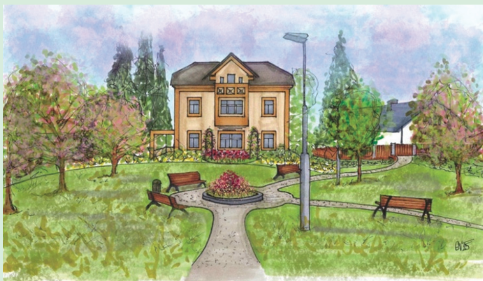
Ilustrace nového prostranství před zdravotním střediskem.

základě požadavků vedení obce realizovalo Povodí Labe posekání travin v korytě potoka a je přislíbena následně vyřezání dřevin – v době vegetačního klidu. Dále hledáme varianty technické úpravy koryta potoka Lodrantky pro zlepšení odvodu povrchové