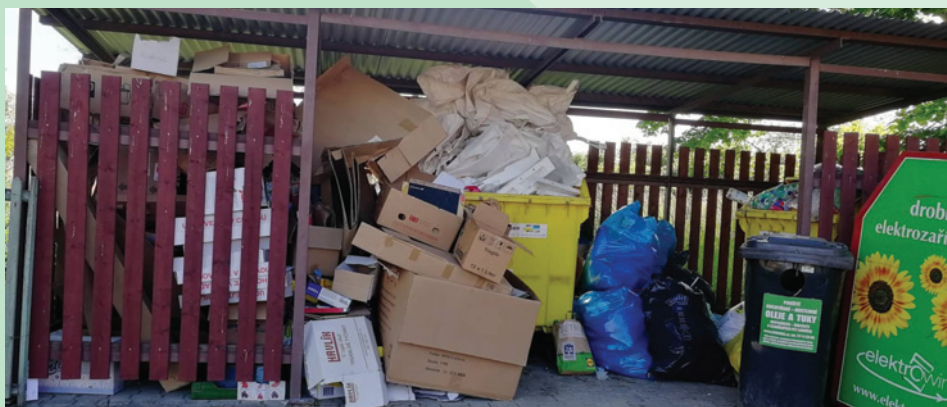
Litětiny - odpadové místo.

vých vod z obce. Zároveň opět apelujeme na naše občany, aby se zdrželi jakýchkoliv úprav koryta vodního toku Lodrantky, které by mohly mít za následek zhoršení odtokových poměrů, neodkládali na břehy jakýkoliv materiál, odpady všeho druhu a podobně. Děkujeme za pochopení. Byli jsme také informováni, že se na naše občany obrací zástupci pojišťovny v souvislosti se stanovením záplavového území. Jejich jednání vychází pouze z podmínek pojištění, které si stanovují vlastní záplavové mapy.